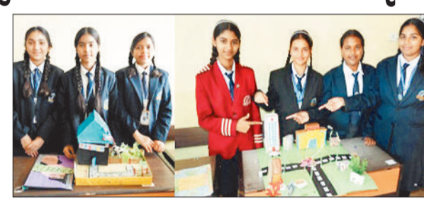
मॉडल का प्रदर्शन करती छात्राएं।

गुरुकुल स्कूल में नवाचार पर आधारित विज्ञान प्रदर्शनी का आयोजन